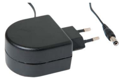
Transformador de Tensión