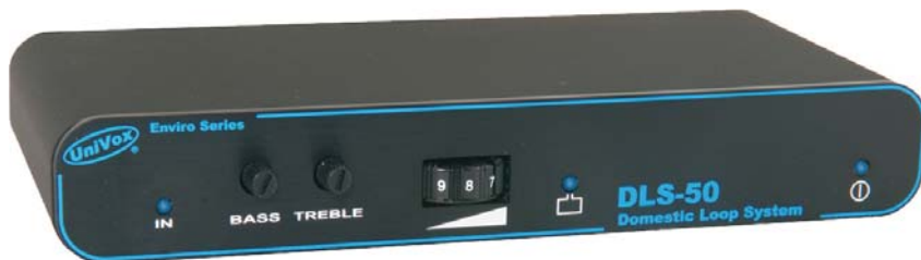
Amplificador DLS 50